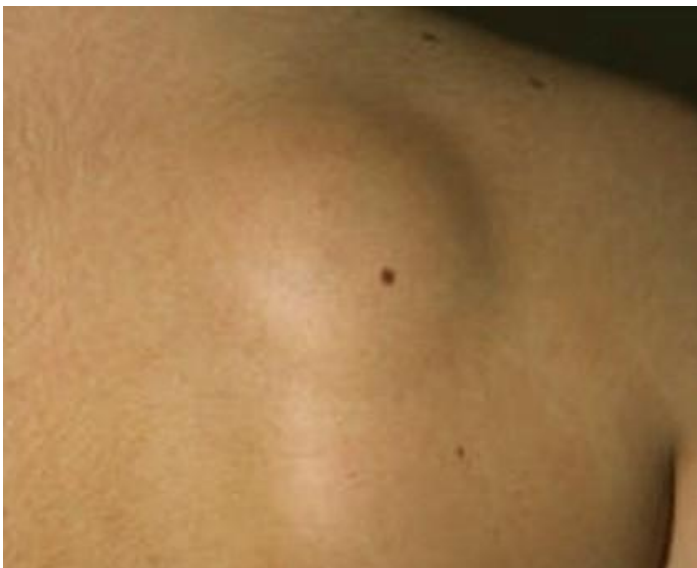
LIPOMA EN LA ESPALDA

El diagnostico suele hacerse a la exploracion medica y en ocasiones ante la duda o a la infiltración de partes esenciales ( nervios, tendones etc) se hace ecografia o resonancia magnetica