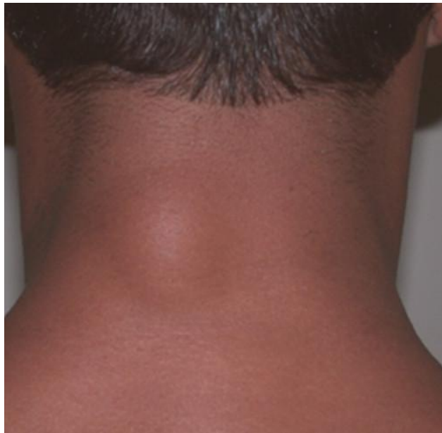
LIPOMA EN LA NUCA

Habitualmente suele crecer y llegar a producir compresion, dolor, imposibilidad de mover una articulacion si se encuentran cerca de una flexura, hueso, articulacion e incomodidad llegando a tener un gran tamaño